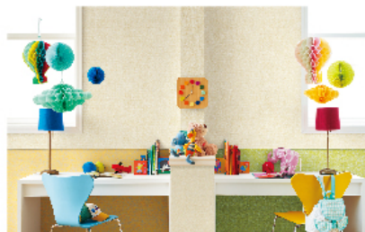
クイックジョイナー