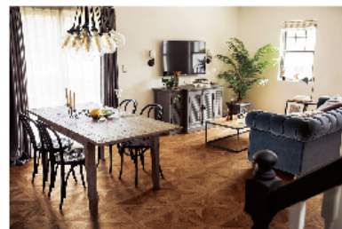
クッションフロア

Copyright(C)2018 Sincol Group All Rights Reserved.